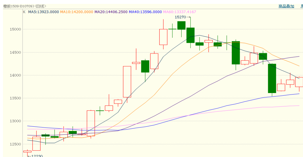
图 1、沪胶 1509 5 月 25 日行情走势