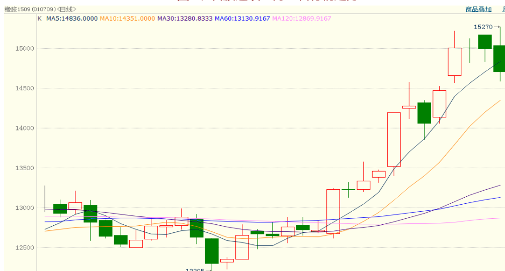
图 2、日胶连续 5 月 7 日行情走势