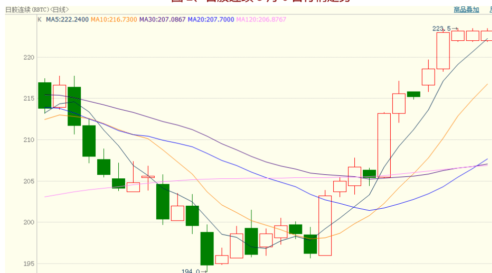
图 2、日胶连续 5 月 6 日行情走势