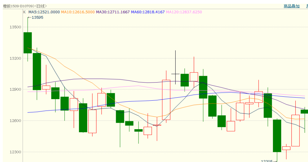
图 1、沪胶 1509 4 月 14 日行情走势