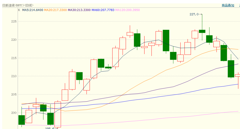
图 2、日胶连续 3 月 9 日行情走势