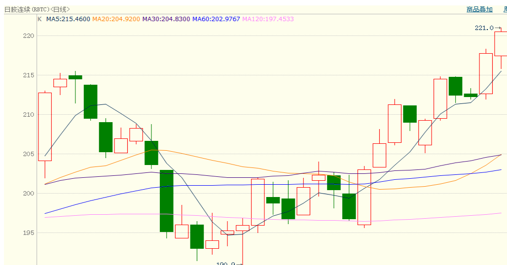
图 2、日胶连续 2 月 13 日行情走势