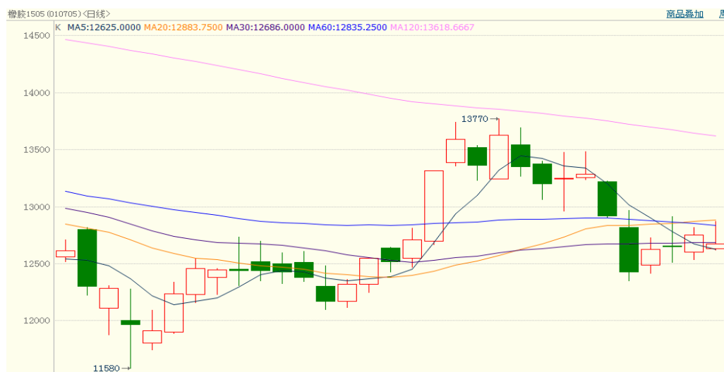
图 1、沪胶 1505 1 月 20 日行情走势