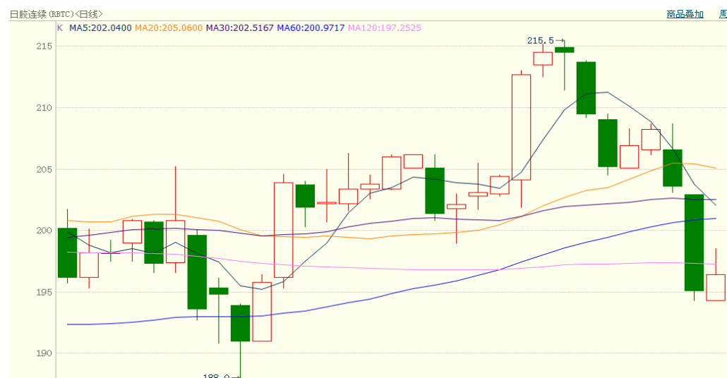
图 2、日胶连续 1 月 15 日行情走势