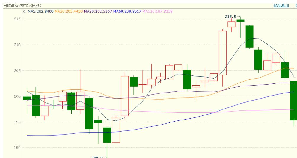
图 2、日胶连续 1 月 14 日行情走势