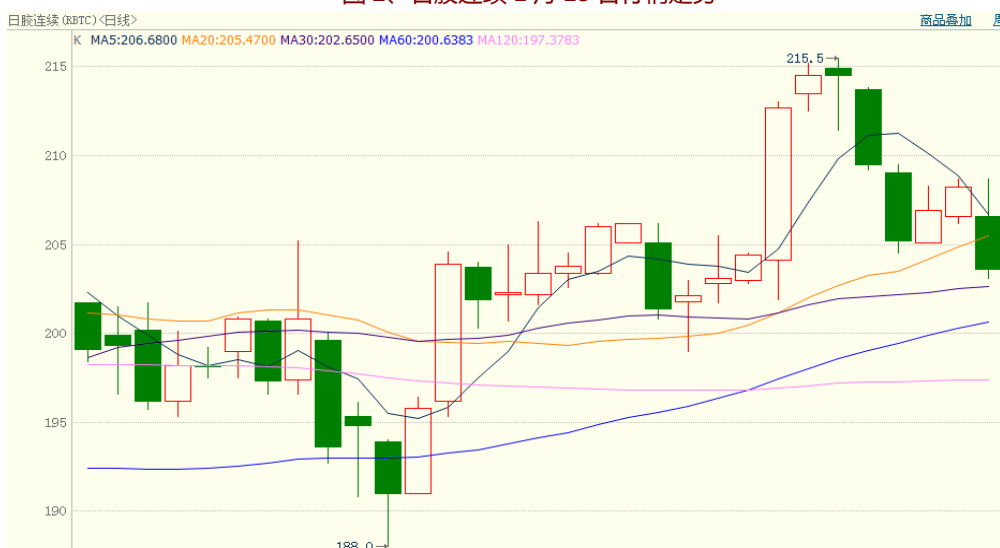
图 2、日胶连续 1 月 13 日行情走势