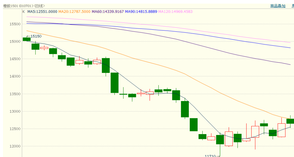
图 1、沪胶 1501 10 月 14 日行情走势